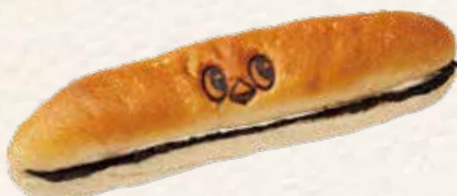
黒ごまミルクフランス 324円(税込) 《リヨンSUDAちらすと》