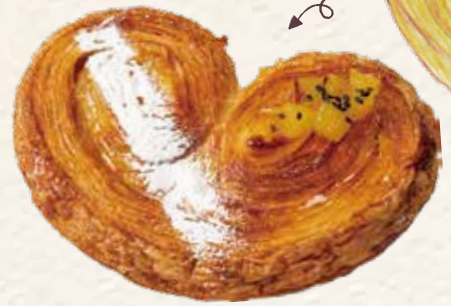
ハートのおいも便り 324円(税込) 《リヨンSUDAコッペ館》