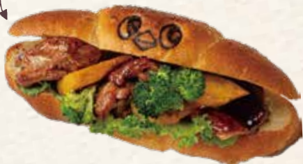
カボチャとチキンのてりやきサンド 594円(税込) 《リヨンSUDAちらすと》