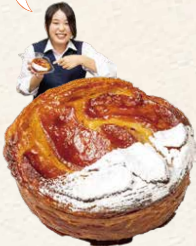
タルトタタン風デニッシュロール 464円(税込) 《リヨンSUDAコッペ館》

県立八千代高校家政科の生徒がイメージしたパンを、市内のパン屋さんが形にしたオリジナルのパン「やちパン」ができあがりました。9回目を迎える今回は、黒板消しをイメージした「けしパン」、食べた人に温かい幸せをお届けする「ハートのおいも便り」などを考案。12種類の個性溢れる美味しい「やちパン」に出会ってみてください!