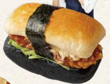
けしパン 540円(税込) 《リヨンSUDAちらすと》