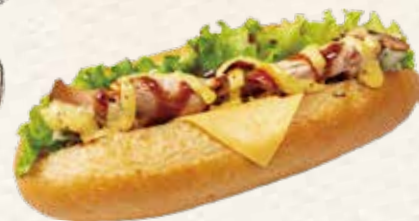
チャーシューマスタードチーズパン 429円(税込) 《ヨークマート・ヨークフーズ・イトーヨーカドー》