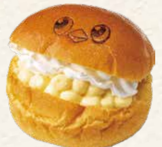
やっちのクリームパン(洋梨入り) 321円(税込) 《ヨークマート・ヨークフーズ・イトーヨーカドー》