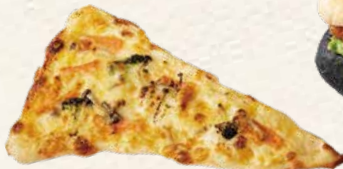
サドルパン 389円(税込) 《リヨンSUDAちらすと》