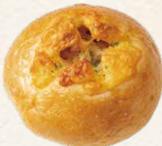
ジャーマンポテトパン 345円(税込) 《ピーターパン》