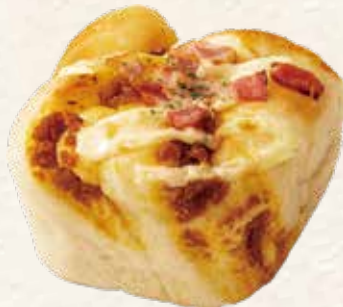
カボッチャ! 216円(税込) 《リヨンSUDAコッペ館》