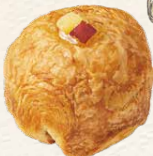
おさつデニッシュ 248円(税込) 《ピーターパン》