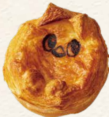
やっちのポットパイ 378円(税込) 《リヨンSUDAコッペ館》