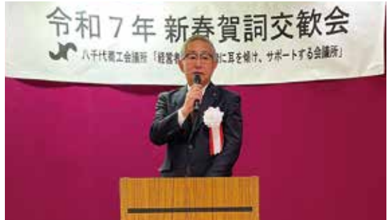
▲挨拶をする周郷会頭

1月10日(金)、当所主催の新春賀詞交歓会をエルムサロンにて開催しました。 周郷会頭は、挨拶の中で、中小企業が直面する歴史的な円安や物価高、「賃上げ」といった経済面の課題に触れ、それらへの対応に取り組むことが商工会議所の使命であると強調し、課題解決の鍵として価格転嫁の実現が重要であると述べました。 また、本年度のテーマとして「経営者の声に真摯に耳を傾け、サポートする会議所」を掲げ、急激に変化する環境に対応すべく努力されている会員事業所の皆様に寄り添い、全力で支援し、地域社会とともに成長していく決意を表明しました。 当日は約150名が参加され、新年を祝う華やかな会となりました。八千代市長をはじめ、市議会議長、国会議員、県議会議員の皆様など、多くのご来賓にもご臨席いただき、温かいご挨拶を賜りました。また、参加者同士による情報共有も活発に行われ、新年の交流を深めるとともに、地域経済への期待が高まる有意義なひとときとなりました。