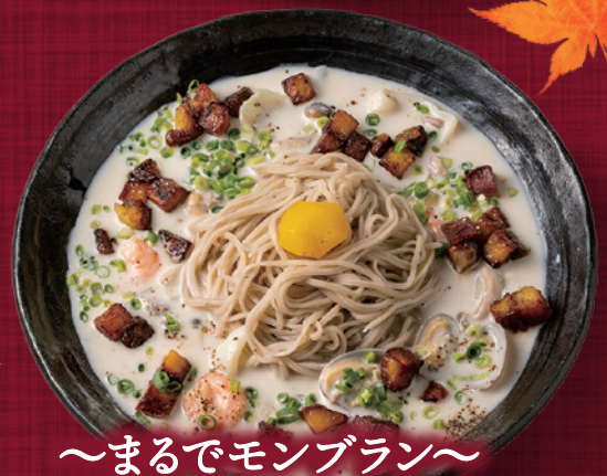
～まるでモンブラン～ 秋香るクラムチャウダーそば 温