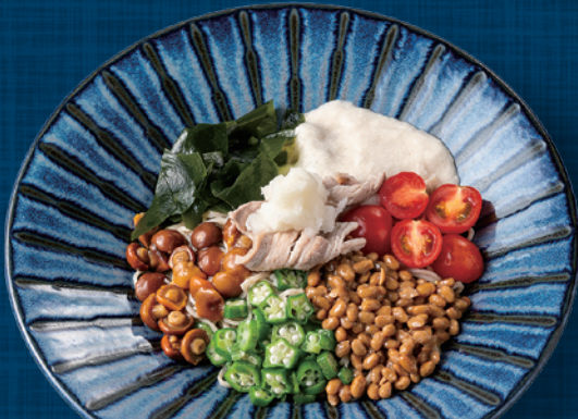
気分はサッパリ!! ネバネバそば 冷