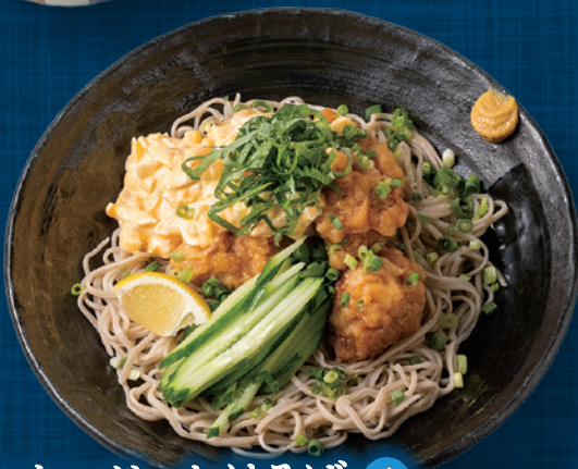
とりタルぶっかけそば 冷