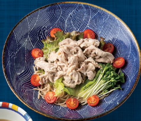
ごまピーナッツ つけそば 冷