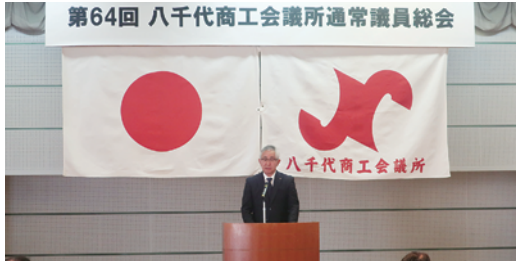
▲挨拶をする周郷会頭

3月21日(木)、第64回当商工会議所通常議員総会を開催し、令和6年度事業計画(案)及び収支予算(案)が原案のとおり可決承認されました。 今年度は、全会員事業所を訪問し、事業所それぞれのニーズに対応した支援に、全力で取り組んでまいります。