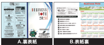
▲広告掲載イメージ

『八千代商工会議所ビジネスノート』は年末に全会員事業所・市内公共団体等に送付させていただいたく年商スケジュール手帳です。巻末に様々な実用ガイドを盛り込んだ本ノートに広告掲載し、あなたの事業所をPRしませんか?