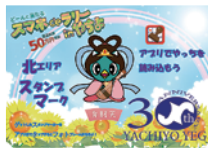
▲スタンプマークをレジ横等に掲示するだけです (画像は昨年度のもの)

お客様がスタンプラリー専用アプリでデジタルスタンプマークを読み込むと、アプリ上でスタンプが集められる仕組みなので、特別な機器類は一切必要ありません。ぜひ参加店登録をいただき、みんなで地域を盛り上げていきましょう!